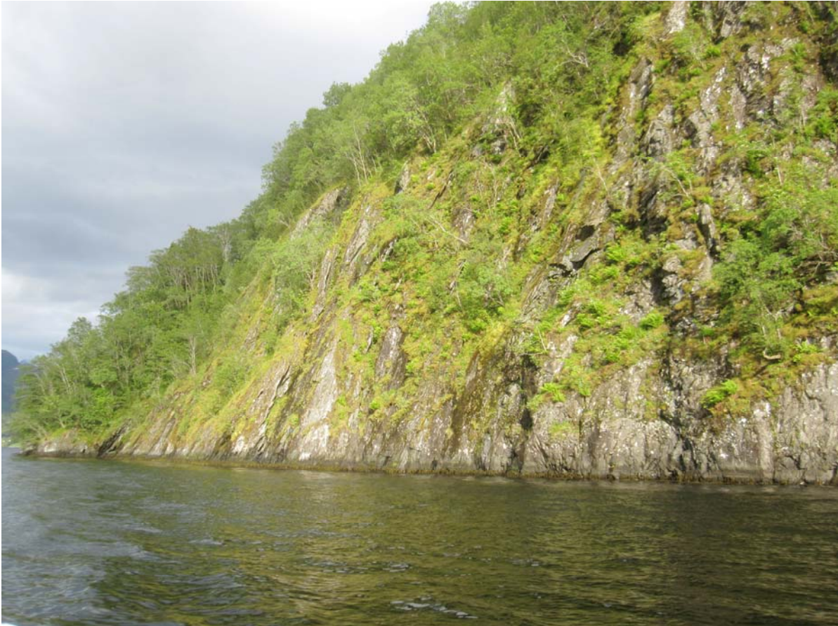
Foto: An solch steil abfallenden Felswänden sollten man es mal auf Pollack versuchen....

Aber erst einmal etwas Grundsätzliches: Im Flachwasserbereich nehmen Fische Schallwellen durch ihr Seitenlinienorgan besonders stark wahr. Jeder Lärm im Boot oder in der Umgebung ist Gift und mindert die Erfolgsaussichten enorm.