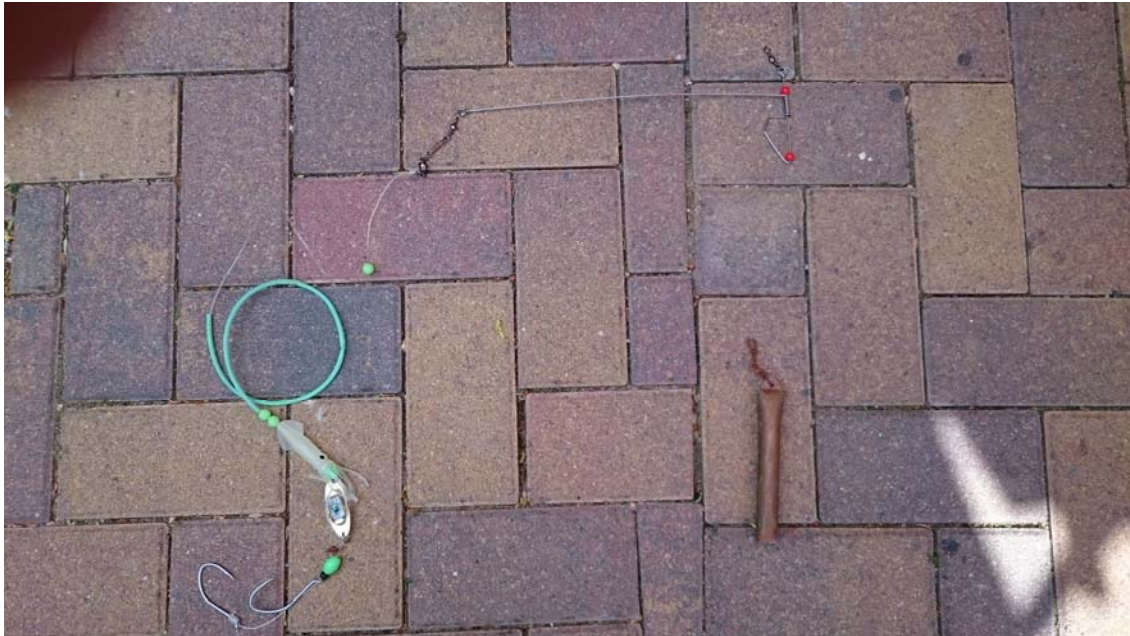
Foto: Komplette Naturködermontage mit Drahtseitenarm und Schleppegewicht. Das Schleppegewicht ist mit einer 0,30 mm Monoschnur am Drahtseitenarm als „Abrissmontage“ befestigt. Auf dem Foto ist die Monoschnur nur schlecht zu erkennen...

Foto oben: Selbst gebundene Naturködermontage mit zwei 12/0 Haken und „Flash Light“. Der zweite Haken ist verschiebbar und kann somit der Ködergröße besser angepasst werden. Das „Flash Light“ blinkt bei Wasserkontakt in regelmäßigen Abständen und soll eine bessere Reizwirkung auf Leng haben. Ich habe es noch nicht mit solch einem Blinklicht versucht, die Montage soll dieses Jahr getestet werden.