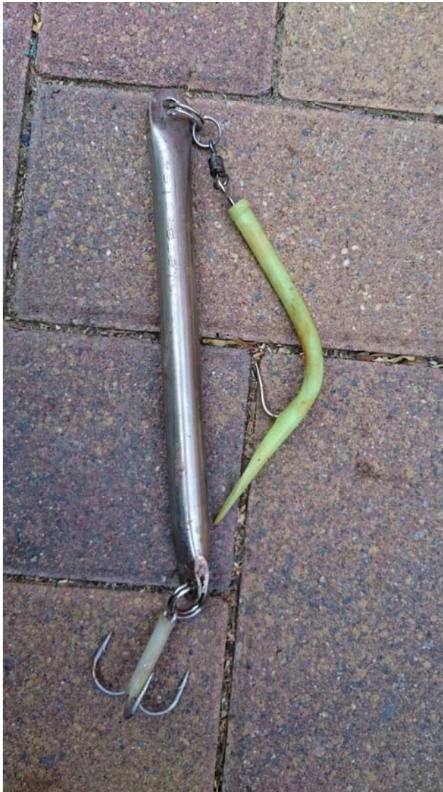
Foto: Selbstgebauter Stabpilker aus einem Edelstahlwasserrohr, welches mit Blei ausgegossen wurde. Das Gewicht beträgt ca. 350 g. In den oberen Sprengring habe ich einen Gummimakk als Beifänger eingehängt. Mit solch einem Pilker hat man die Chance durch einen Kleinköhlerschwarm zu kommen....

Will man also an die größeren Exemplare heran, ist man gezwungen einen schweren schlanken Pilker zu verwenden (Stabpilker), der sozusagen durch den Schwarm Richtung Grund durchschießt, ehe er von den kleineren Köhlern genommen werden kann. Ist der Stabpilker bis zum Grund durchgekommen, pilkt man diesen dann von unten durch den Schwarm, in der Hoffnung dass ein großer Köhler, Pollack oder Dorsch einsteigt.